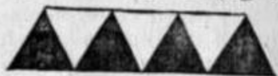
(FIGURA N° 2)

calan líneas quebradas de ángulos iguales que dan lugar a triángulos. (fig. 1).