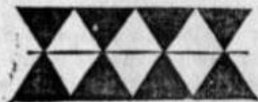
(FIGURA N° 3)

añadiendo una tercera línea paralela en la cual se repiten los ángulos coloreados, da lugar a la ornamentación conocida vulgarmente con el nombre de