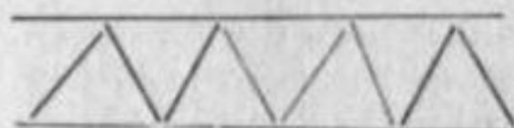
(FIGURA N° 1)

calan líneas quebradas de ángulos iguales que dan lugar a triángulos. (fig. 1).